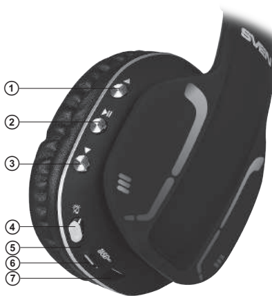
Imag. 1. Construcția căștilor