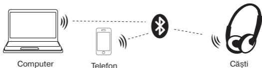
Imag. 2. Schema conectării

* Pentru conexiunea prin Bluetooth cu unele modele de dispozitive, posibil va fi nevoie să introduceți codul «0000».